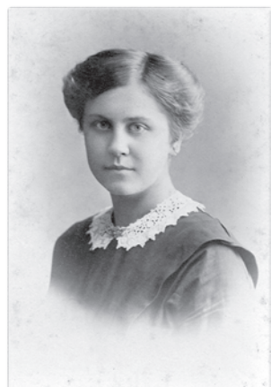
Ариадна Александровская. 1914 г.