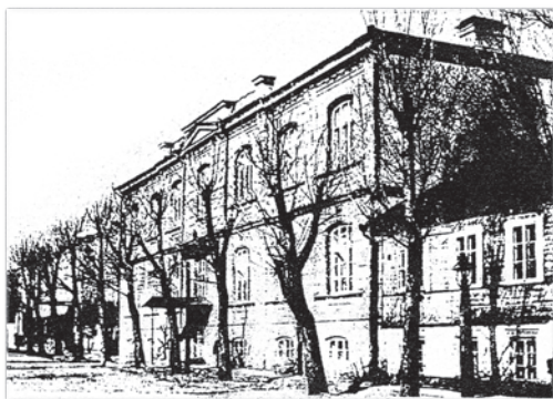
Старый Минск: Мариинская женская гимназия. Здание сохранилось