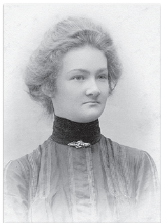
Инна Ивановна Ладыгина. 1912 г.

он при этом. — Ты идешь-идешь — и согреешься! А я выскочил — и замерз!» Эта приговорка дурашливого гимназиста прижилась в нашей семье, часто со смехом вспоминалась в той или иной ситуации. А между прочим, этот маленький смешливый гимназист из Острога спустя десятилетия станет известнейшим советским полководцем — генералом армии, начальником Генерального штаба Советской армии!